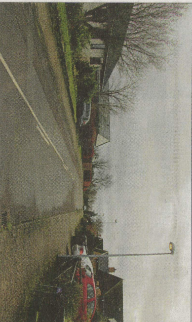
Et hul i Ternevej i Viby endte med en halvanden år lang kamp for grundejerforeningen, fordi der var tvivl om, hvem som havde ansvaret for kloakkerne. Nu er sagen endt, og den er faldet ud til fordel for grundejerne. Fremover er det nemlig Fors, som har ansvaret for kloakkerne.